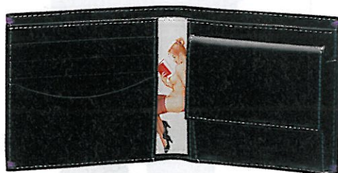
Paul Smith € 175,-