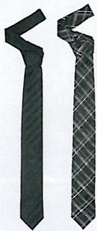
Selected Homme € 19,95