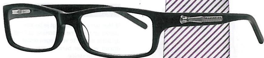
Karl Lagerfeld € 194,95