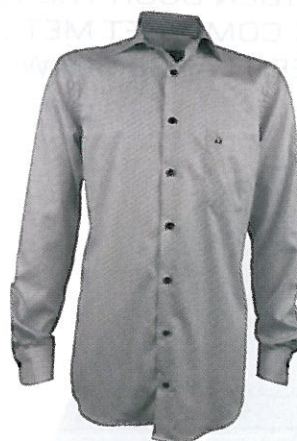
Ledùb € 59,95