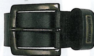
Wrangler € 44,95