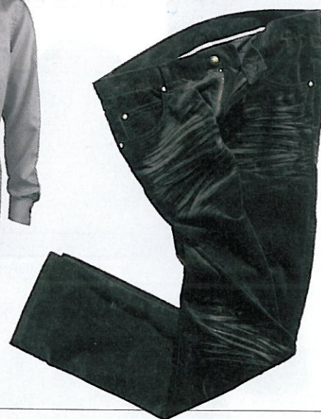
H&M € 29,95

FLUWEEEL, GLANZENDE COATINGS EN FLANEL; STOFFEN MET EEN OPTISCH EFFECT GEVEN EEN FEESTELIJK TINTJE AAN JE OUTFIT.